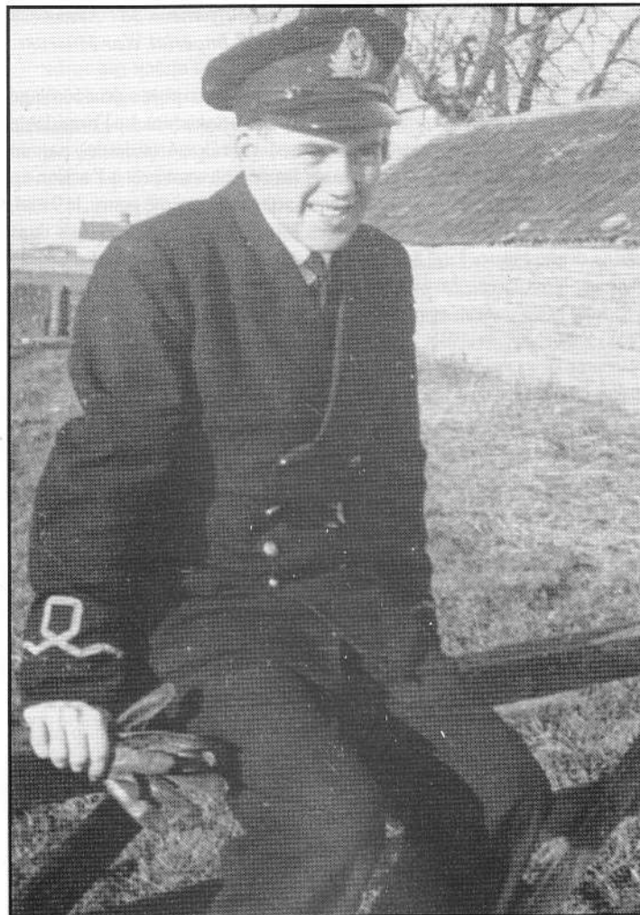
Robert Hampton Gray, HMS Heron , Yeovilton, décembre 1941