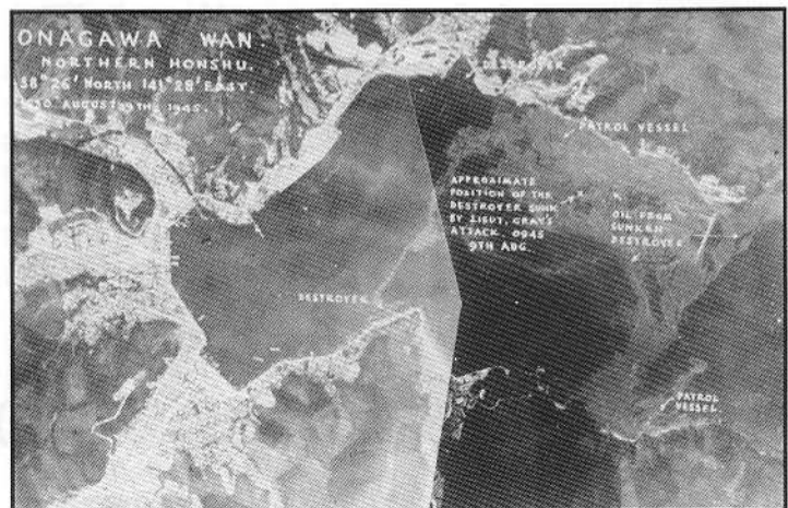
Photographie aérienne de l'Onagawa Wan, le 9 août 1945