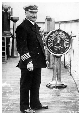
Capitaine William Turner

Avant le départ du Lusitania , l'Ambassade impériale d'Allemagne aux États-Unis avait publié la mise en garde suivante dans cinquante journaux américains.