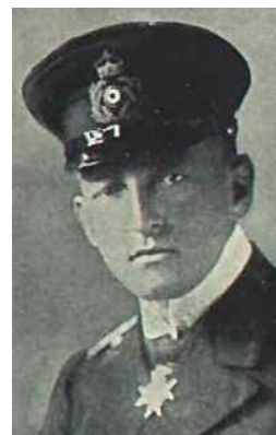
KptLt Walther Schwieger

commandement de Kapitänleutnant Walther Schwieger. C'est par pur hasard que le paquebot est devenu une cible si facile, car l' U-20 n'aurait pas pu atteindre, en d'autres circonstances, le paquebot qui naviguait à une si grande vitesse. Schwieger a lancé une seule torpille et celle-ci a atteint la région qui se trouve tout juste au-dessous de la passerelle. La torpille laissa un trou sur le bord du navire et elle fût suivie par une explosion secondaire encore plus importante qui fit éclater le tribord avant.