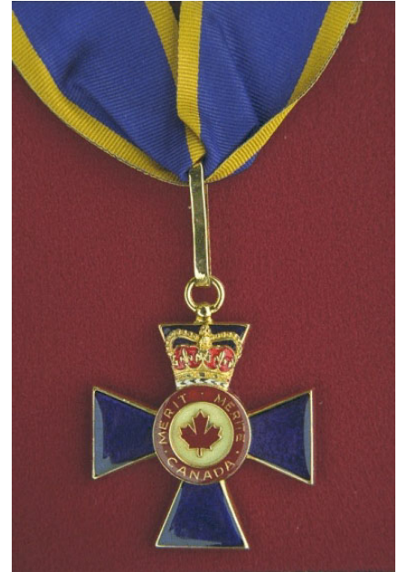
Médaille du C.M.M.

De plus amples renseignements sur les distinctions honorifiques et les médailles commémoratives de campagne ou les médailles pour