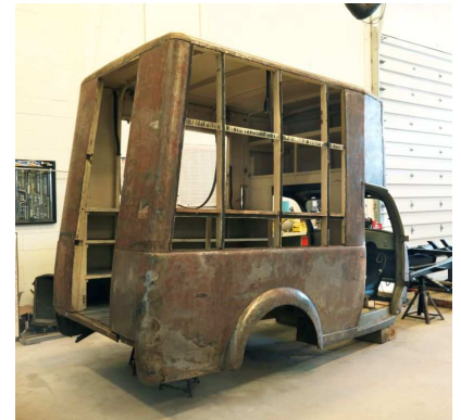
La fourgonnette d'alimentation en cours de restauration dans l'atelier du MCG.

Jim Whitham, gestionnaire des collections (transport et artillerie) au MCG, espère que la restauration sera achevée d'ici l'automne 2008.