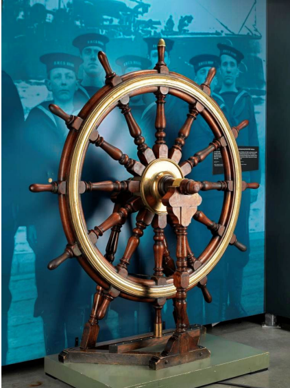
La barre du NCSM Rainbow exposée à la galerie 2. MCG 19470006-001

Comme on l'a mentionné dans le numéro de mai du Flambeau , les Amis sont fiers de souligner le centenaire de la Marine (le 4 mai 2010) en rédigeant une série de suppléments de quatre pages qui seront ajoutés au bulletin à partir du présent numéro jusqu'à celui de mai 2010.