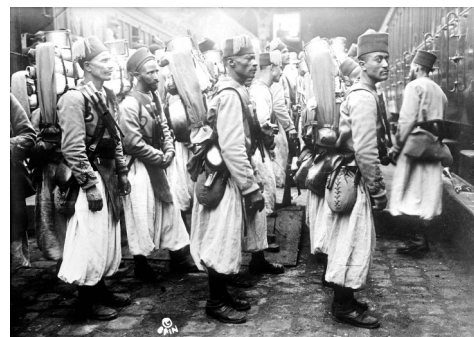
Des soldats algériens en Europe lors de la Première Guerre mondiale.

Vous serez, j'en suis sûr, fasciné par cette collection, à laquelle vous pouvez accéder en déroulant les photos sur notre site Facebook ou en vous rendant directement à l'adresse http://www.theatlantic.com/static/infocus/wwi/glibal/ . En voici, plus bas, un exemple.