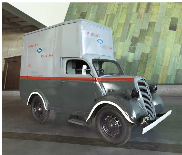
La fourgonnette d'alimentation Fordson à la Galerie LeBreton (pour la photo).

La restauration de la fourgonnette d'alimentation Fordson, commanditée par les Amis du Musée, est presque terminée. Le véhicule sera bientôt exposé à la Galerie LeBreton. Notre exemplaire de cet artéfact est unique parmi les 450 fourgonnettes du genre produites par Ford et données à la Grande-Bretagne par Henry et Edsel Ford. La fourgonnette se rendait sur les sites de raids aériens pour offrir du thé et de la nourriture aux équipes d'urgence et aux survivants.