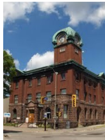
Musée Sault Ste Marie

Des changements importants aux expositions de la Galerie Le-Breton se produiront bientôt. Le Musée regroupe et repositionne l'équipement afin de l'organiser en fonction de thèmes plus cohérents; on posera également de nouvelles affiches signalétiques plus complètes et visibles. Les travaux devraient être terminés à la fin mars. Les visiteurs et Amis en seront ravis.