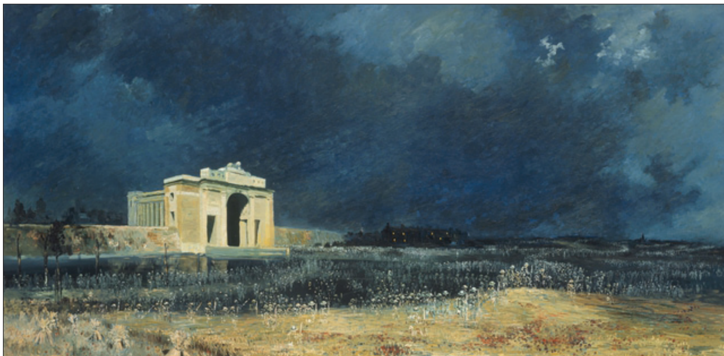
AUSTRALIAN WAR MEMORIAL

Les motifs utilisés par Longstaff pour déclencher l'émotion sont bien connus, à commencer par les coquelicots écarlates que l'on trouve dans les champs de Flandre. Outre les connotations traditionnelles de sang versé et de commémoration, l'on peut y voir un linceul fleuri recouvrant les dépouilles ensanglantées de soldats anonymes. Mais en même temps les coquelicots, comme ceux confectionnés en papier que l'on porte le Jour du Souvenir, sont un hommage des vivants envers les morts. La représentation des soldats revêtus de leur casque d'acier et surgissant