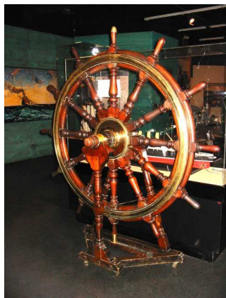
La barre du NCSM Rainbow exposée à la galerie n° 2.

Le 4 mai 2010 marquera le centenaire de la fondation de la Marine royale canadienne. Pour célébrer cet événement, le conseil d'administration des Amis du Musée a donné son aval à trois initiatives spéciales :