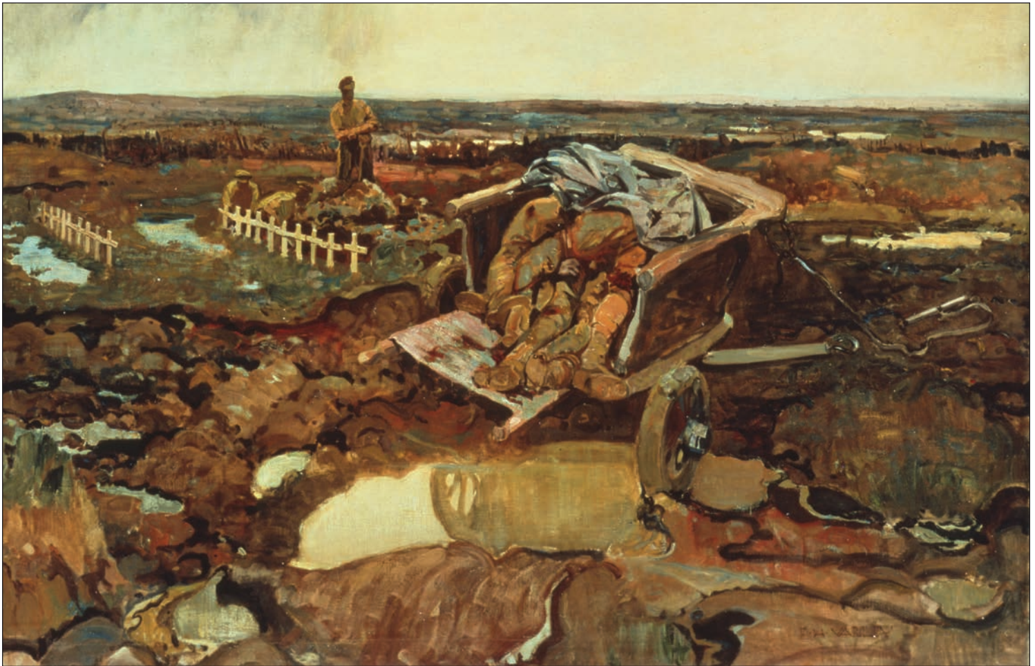
Pour quoi? Peint en 1918 par Fred Varley (CWM 10910261-0770) Collection Beaverbrook d'art militaire, Musée canadien de la guerre

C'est cet effort de guerre canadien qui a valu au Canada une signature distincte sur le Traité de paix. La nation a été gagnée par les hommes courageux qui ont tenu bon à Ypres, ont pris d'assaut la tranchée de Regina, ont grimpé les sommets de la crête de Vimy Ridge, ont saisi Passchendaele et sont entrés à Mons le 11 novembre 1918.