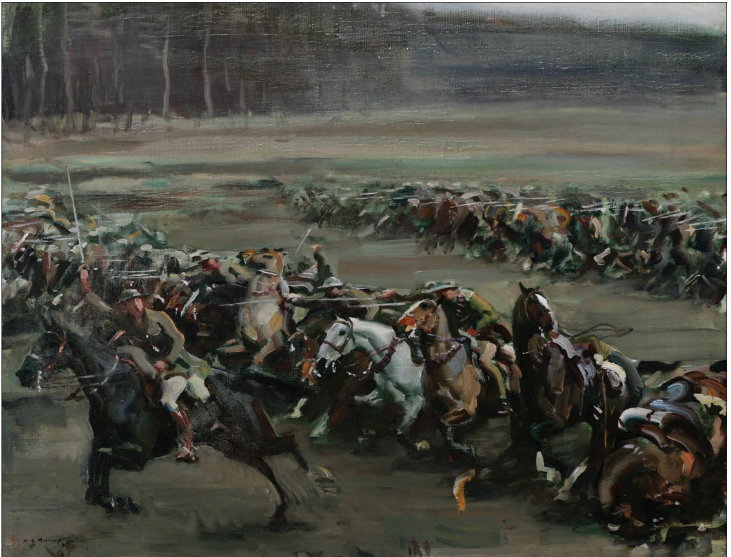
La charge du Flowerdew's Squadron Peint vers 1918 par Alfred Munnings (1878-1959) (MCG 19710261-0443)