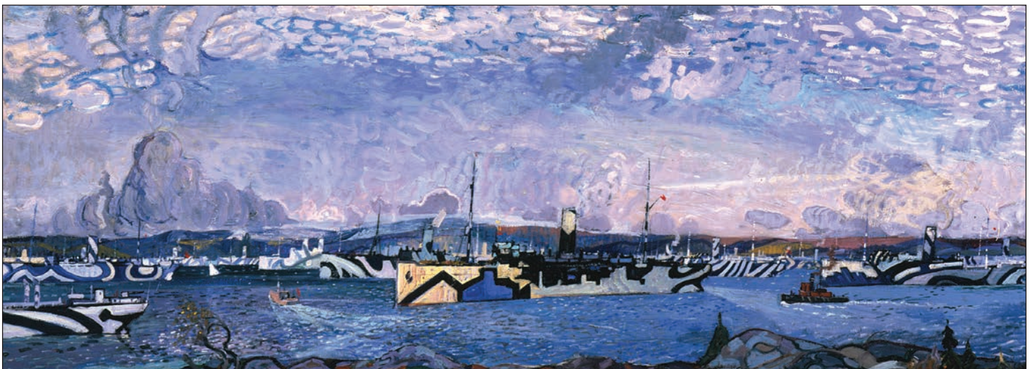
Convoi in Bassin Bedford par Arthur Lismer 1919 (MCG 197102610-0344)