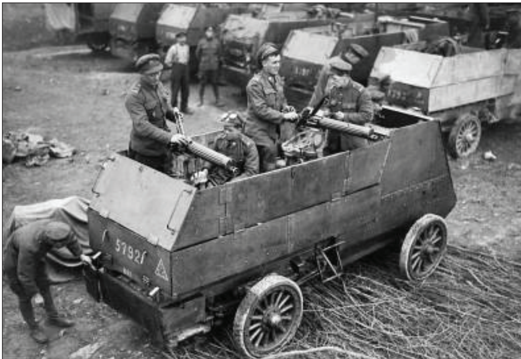
Un des porte-mitrailleuses motorisés authentiques de Brutinel (voir ci-dessous) est exposé dans la Galerie 2 du MCG.

Il s'agit d'une histoire secondaire des Corps mitrailleurs canadiens, préparée, organisée et dirigée par Raymond Brutinel. À l'époque, des armées n'avaient pas encore adopté l'idée de remplacer la puissance de feu, particulièrement celle des mitrailleuses, par la main-d'œuvre. Monsieur Brutinel était responsable du développement d'organisations et de la tactique pour l'utilisation des mitrailleuses, y compris l'utilisation de véhicules blindés motorisés,