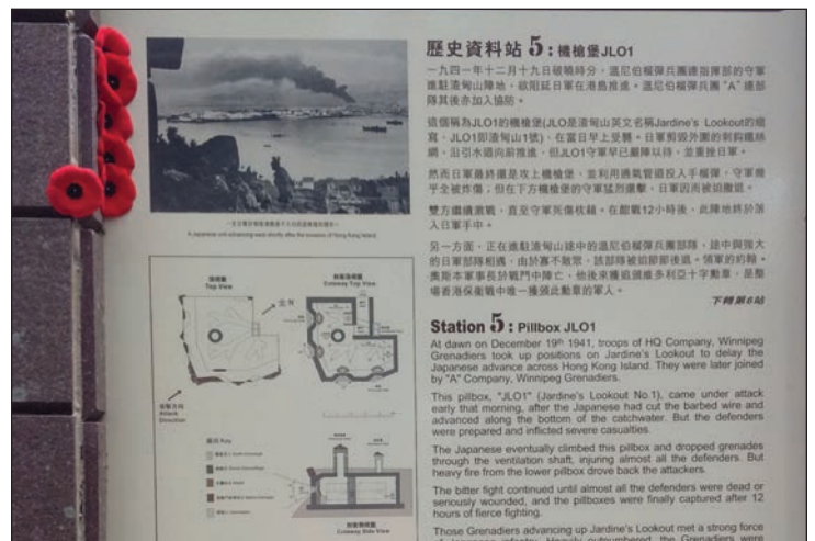
Station 5 – les coquelicots