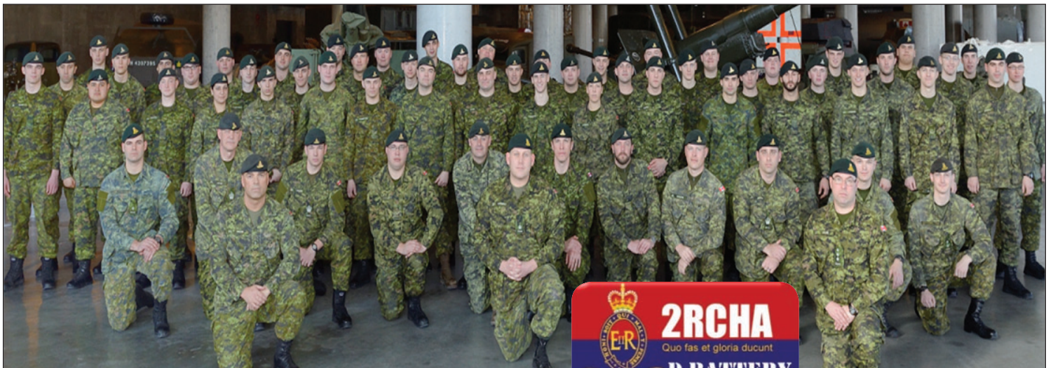
dans la galerie LeBreton