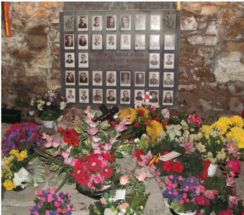
Monument commémoratif aux hommes de Bande tués par les Allemands

C'est alors qu'un troisième point retint notre attention : la participation de l'ARC. Le 24 décembre 1944, la 143 e escadre de l'ARC s'engagea dans la bataille. Sa fonction première était d'attaquer les véhicules blindés ennemis et pour ce faire, les aviateurs faisaient du mitraillage au sol avec des canons de 20 mm. Le premier jour, la 143 e escadre perdit 7 avions et pilotes, les pertes les plus importantes en une seule journée depuis le début de la guerre. Lors de la deuxième mission de la journée, le 438 e escadron, un escadron de Typhoon de l'ARC, déploya sept appareils dans les airs afin de survoler les zones de combat près de Malmedy, Euskirchen, Moyen et Houffalize. En tout, 17 escadrons furent mobilisés. J'ai eu l'occasion, en