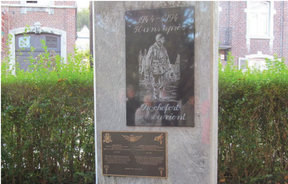
Monument commémoratif, à Rochefort, en l'honneur du 1 er Bataillon de parachutistes canadiens