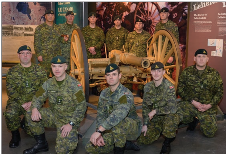
Les cadres supérieurs de la Batterie « D » à côté d'un canon de campagne de 12 livres utilisé par leurs pré-décesseurs à Leliefontein

Pour plusieurs, le clou de la sortie a été de rencontrer les anciens combattants bénévoles au Musée canadien de la guerre