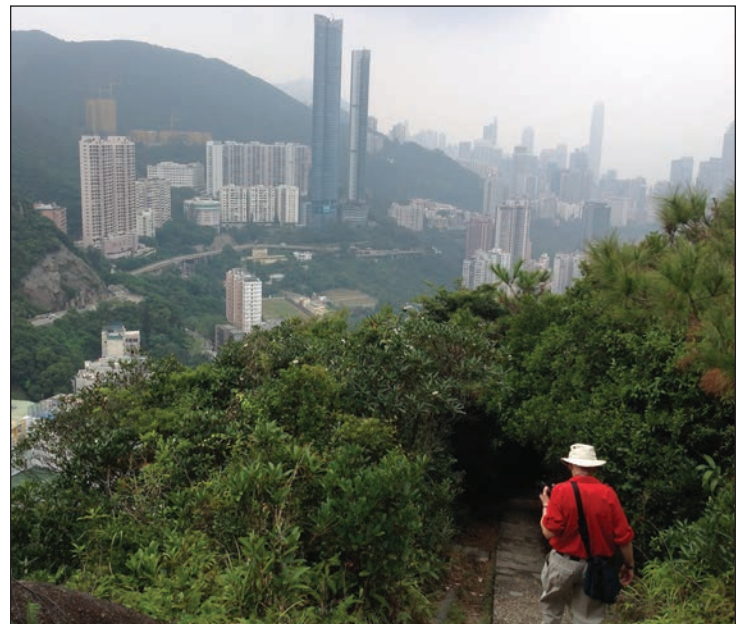
Au sommet du sentier Wong Nai Chung Gap