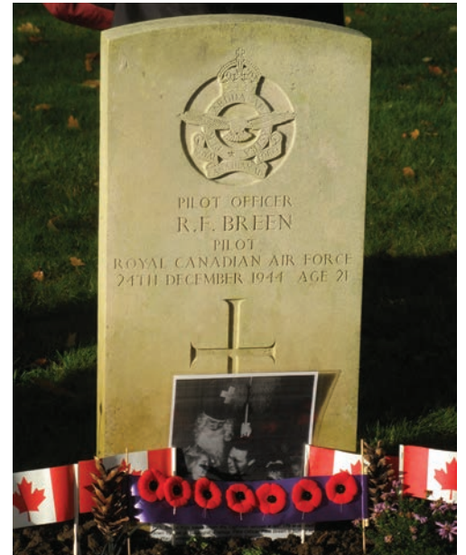
Une des pierres tombales de l'ARC au cimetière de Hotton

juin dernier, de m'entretenir avec 13 anciens pilotes de Typhoon au sujet des combats dans les Ardennes. Ils avaient tous effectué des missions aériennes à cette époque et l'un des pilotes fit remarquer que la bataille des Ardennes ressemblait en tout point à la bataille de la poche de Falaise, sauf que cette fois-ci, les véhicules blindés se détachaient sur un fond de neige.