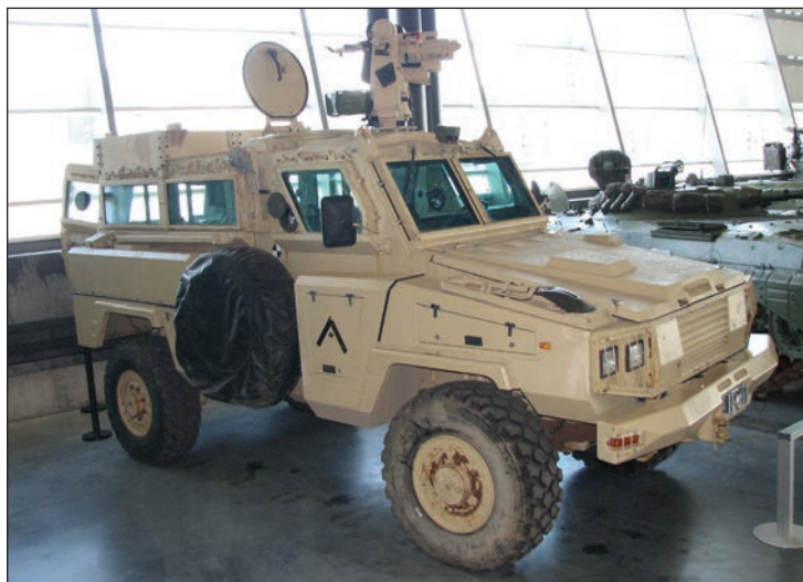
Véhicule RG-31 Mk 3 Nyala

Pour sa part, le célèbre M3 Lee a refait son apparition après une longue période d'arrêt de fabrication à l'usine. Le véhicule Lee a été amené à son endroit familier en utilisant le matériel Air Caster, un système pneumatique à haute pres-