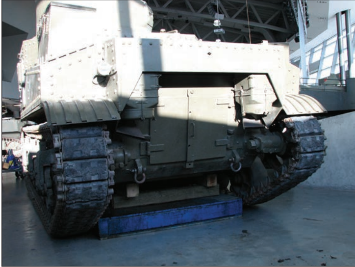
Air Caster placé sous le véhicule Lee