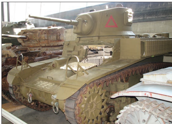
Char M3A1 Stuart

La deuxième nouveauté est un véhicule complet utilisé pendant la guerre d'Afghanistan : le véhicule de patrouille blindé, mieux connu sous le nom de RG-31 Mark 3 Nyala. Imposant véhicule à quatre roues, il a une hauteur de 2,6 mètres (8,5 pieds), sans y inclure le poste de tir télécommandé muni de la mitrailleuse lourde Kongsberg M151 de calibre .50. Ce véhicule provient de l'Afrique du Sud et a été