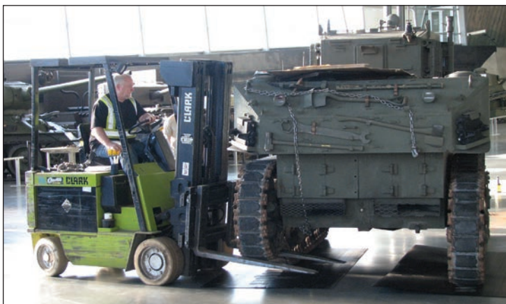
Chariot élévateur polyvalent qui déplace un char d'assaut M5A1