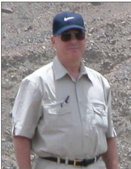
Dans le désert d'Abu Dhabi

En septembre 1989, il a accepté le poste de chirurgien en chef au Centre hospitalier pour enfants de l'est de l'Ontario, à Ottawa, un poste qu'il a occupé jusqu'en juin 2003. Il a ensuite démissionné afin d'accepter un poste de chirurgien en orthopédie pédiatrique au Sheikh Khalifa Medical Centre d'Abu Dhabi,